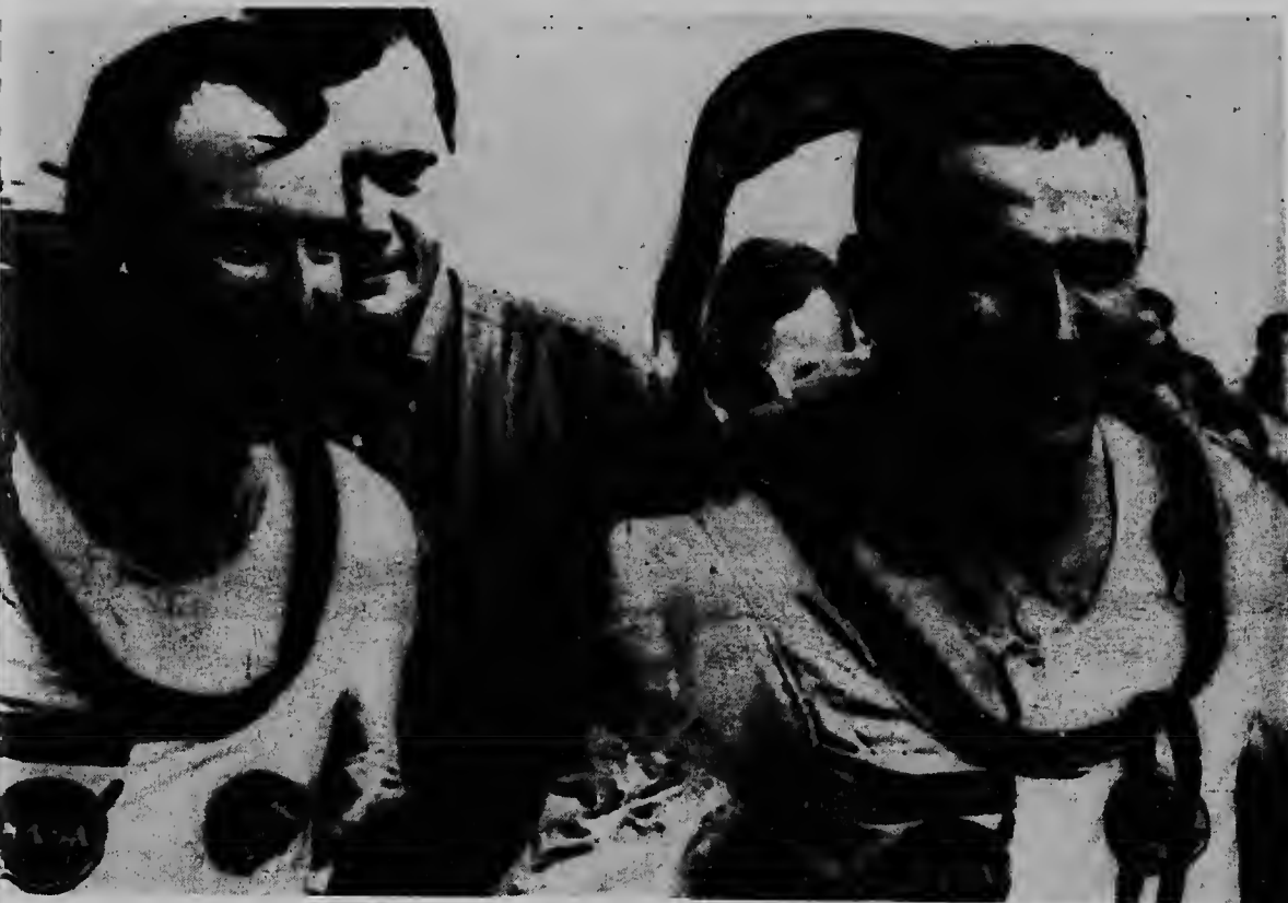
BORDO DI USS WASP: James Lovell, na man robes y Frank Borman ta desplega un sonrisa grandi despues qu nan a subi a bordo di e portavion qu tabata spera riba nan den Atlantico.

CENTRO ESPACIAL di HOUSTON -- UPI -- E campeonnan di espacio Frank Borman y James Lovell a regresa terra a bordo di e cosmonave Geminis-7 y a baha den Atlantico a final di nan dos siman nan di vuelo den espacio.